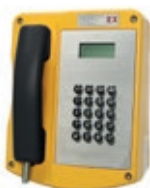
Téléphonie et interphonie