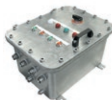
Boîtes, coffrets et accessoires