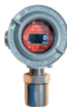
Détection Feu et Gaz