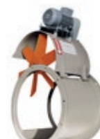
Chaud, Froid, Ventilation